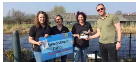
De Swiffers Hoeve 2019

In 2019 viel de dikverdiende eer te beurt aan De Swiffers Hoeve in Nieuwe Wetering. Dieren die zorg en opvang nodig hebben, bijvoorbeeld omdat hun baasje is opgenomen in een instelling of ziekenhuis, worden hier warm ontvangen en kunnen hier tijdelijk verblijven, groot worden of herstellen totdat ze terug kunnen naar de natuur, hun baasje of een nieuw thuis. En als dat niet lukt, kunnen zij blijven als bewoners van de dierenweide. Kinderen kunnen tussen en met de dieren spelen en helpen met de verzorging. En wat geweldig is: zo lang het mogelijk en wenselijk is gaan de vrijwilligers van Swiffers Hoeve met de dieren op bezoek bij het oude baasje.