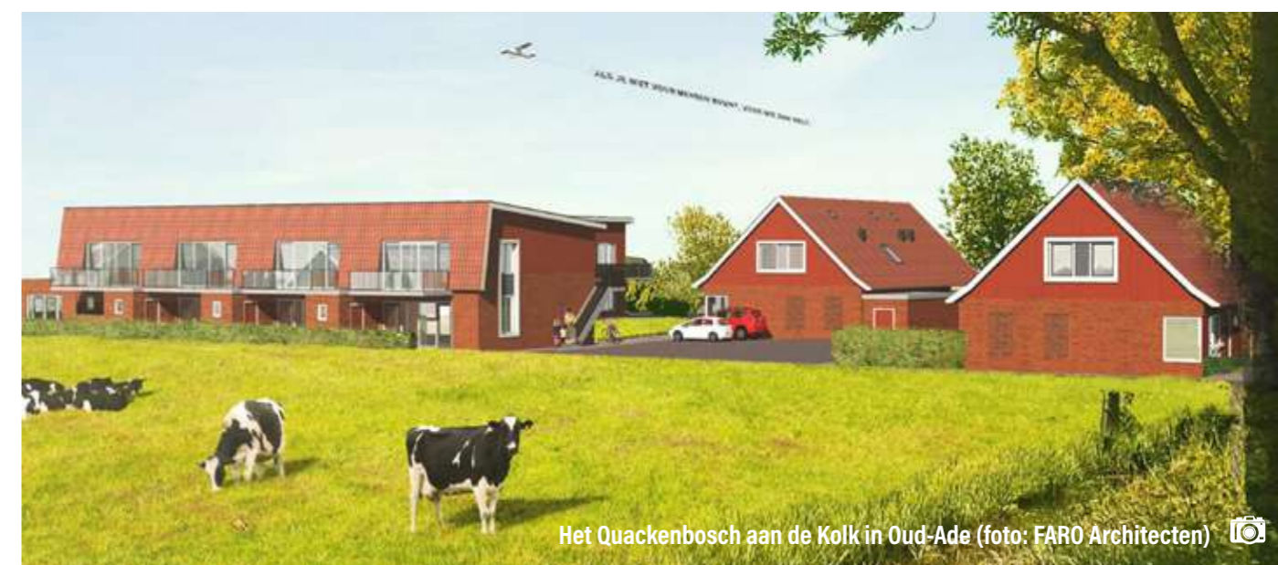
Het Quackenbosch aan de Kolk in Oud-Ade (foto: FARO Architecten)

PRO is voorstander van woningbouw in de kernen en ook aan de randen van deze kernen. Hier voert PRO een flinke lobby op naar de provincie. In 2020 vroegen wij inwoners via een enquête (PROpinie) naar hun mening over hoogbouw. De uitkomst van deze enquête vormt de basis van ons standpunt over hoogbouw. Wij vinden het een goed idee om in de grotere kernen in onze gemeente de hoogte in te gaan, met als voorwaarde dat dit inpasbaar is in de omgeving.